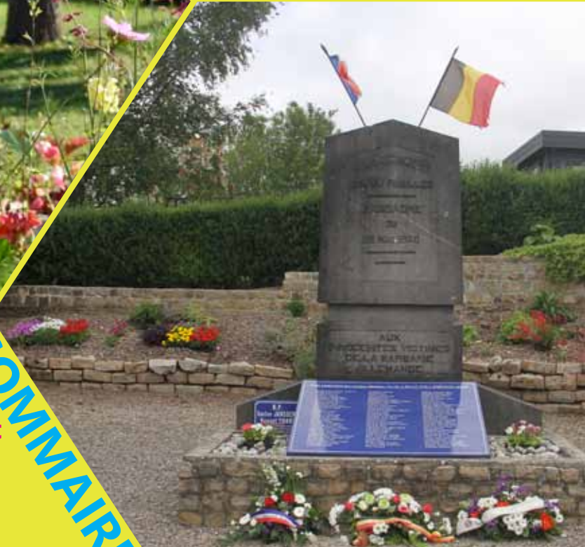
Commémoration des Événements tragiques du 22 Mai 1940